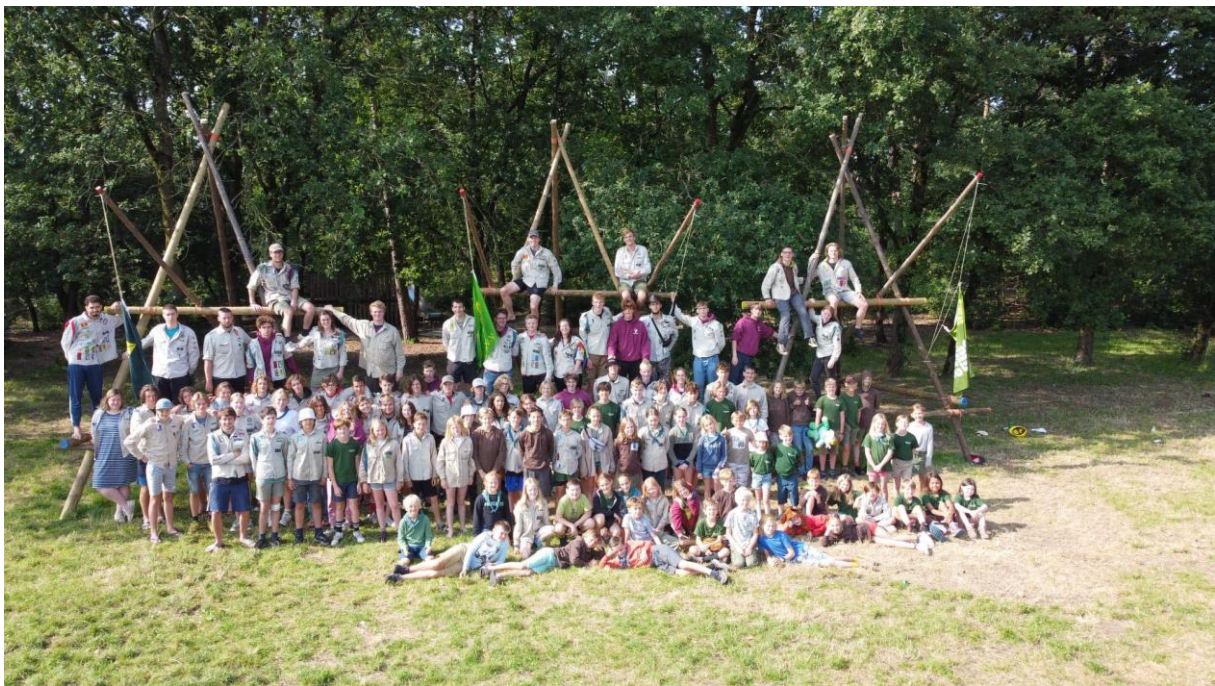
Scouts 21 ste Sint-Elisabeth Zoersel